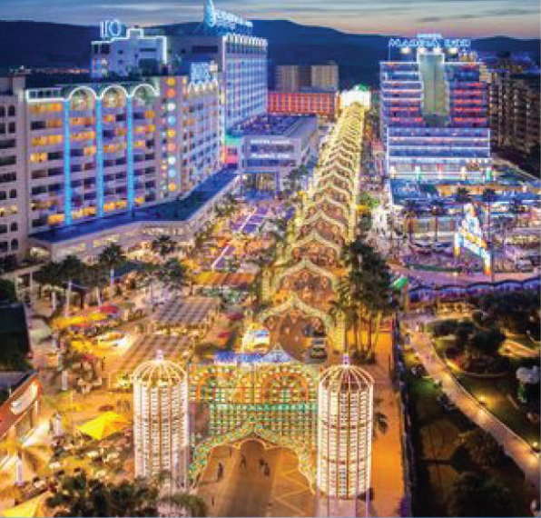
Oropesa del Mar (Spain)